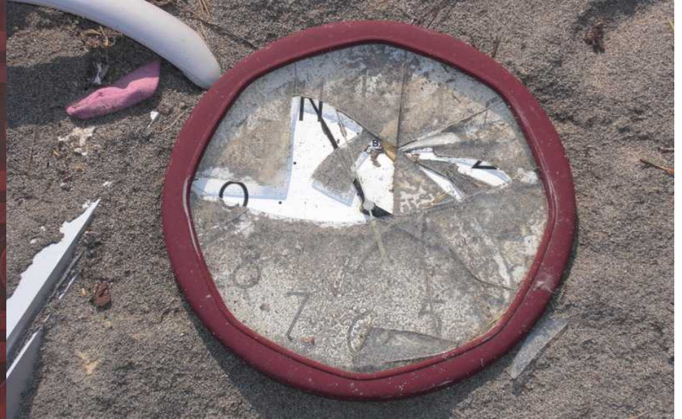
津波襲来時に停止した時計