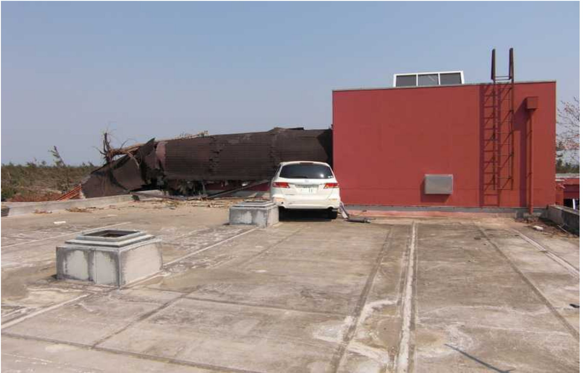
津波に運ばれたか屋上に車（職員の車）