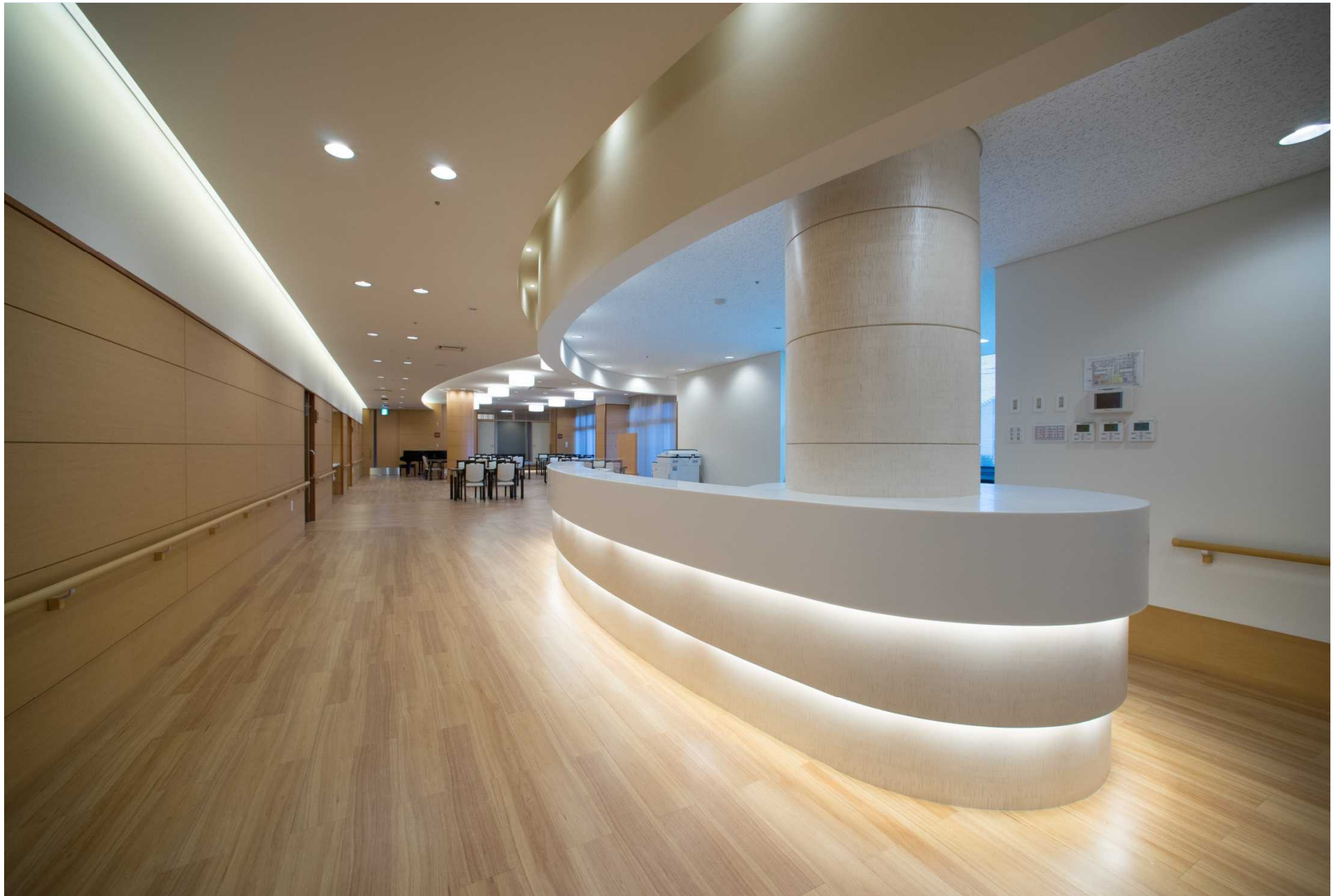
デイサービスセンターくろまつ荘入り口