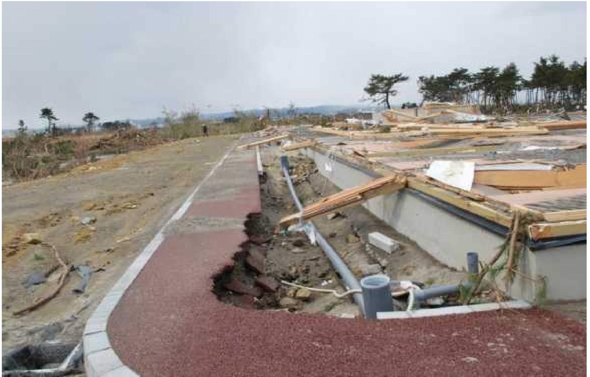
引き渡し直前のグループホーム相野釜（基礎は残る）