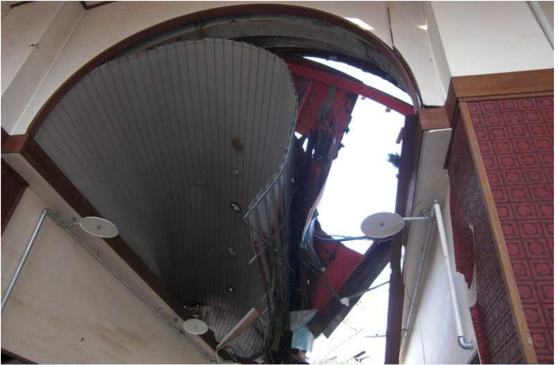
玄関上部ドーム屋根