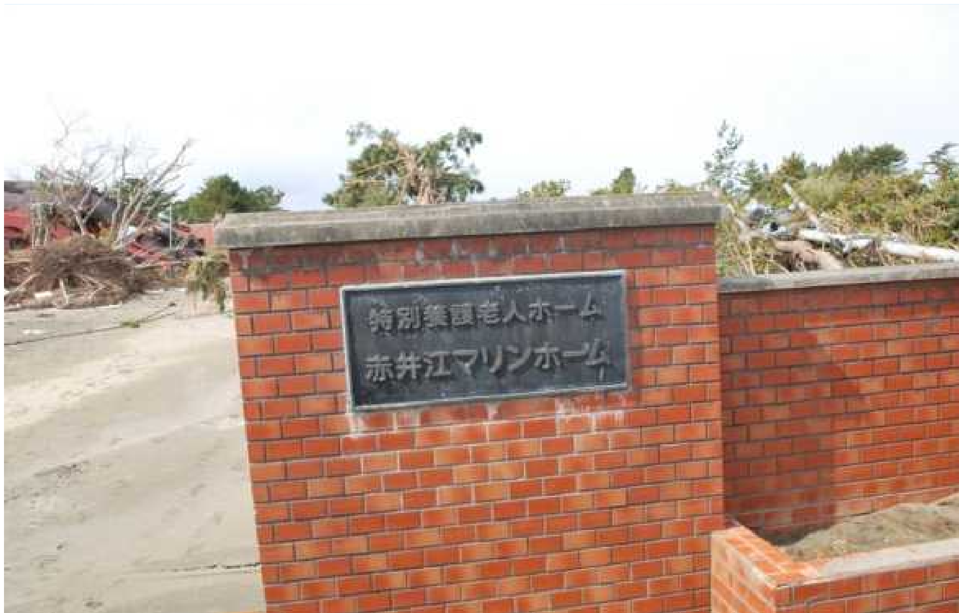
震災後のマリンホームの門前