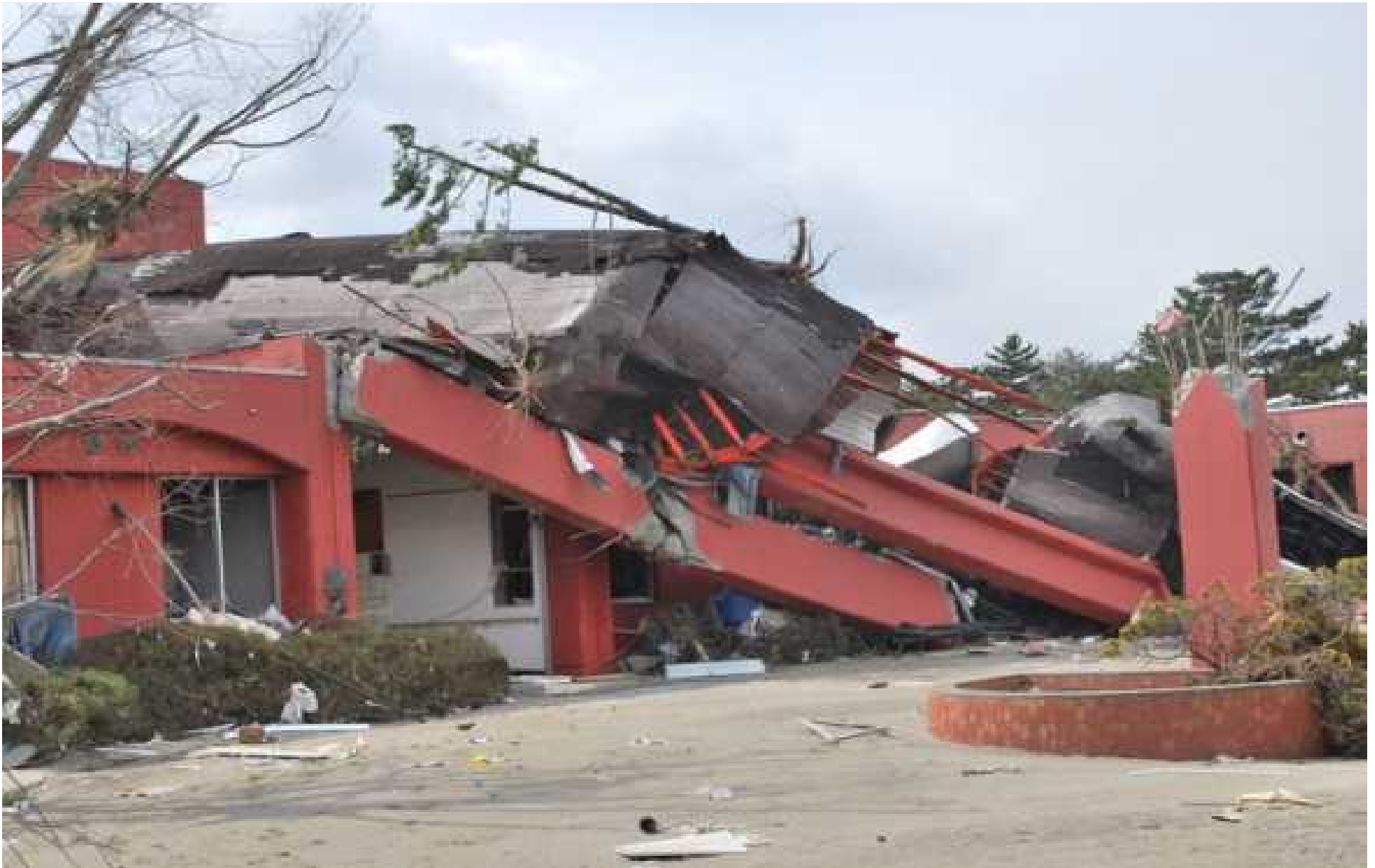
崩壊した玄関付近