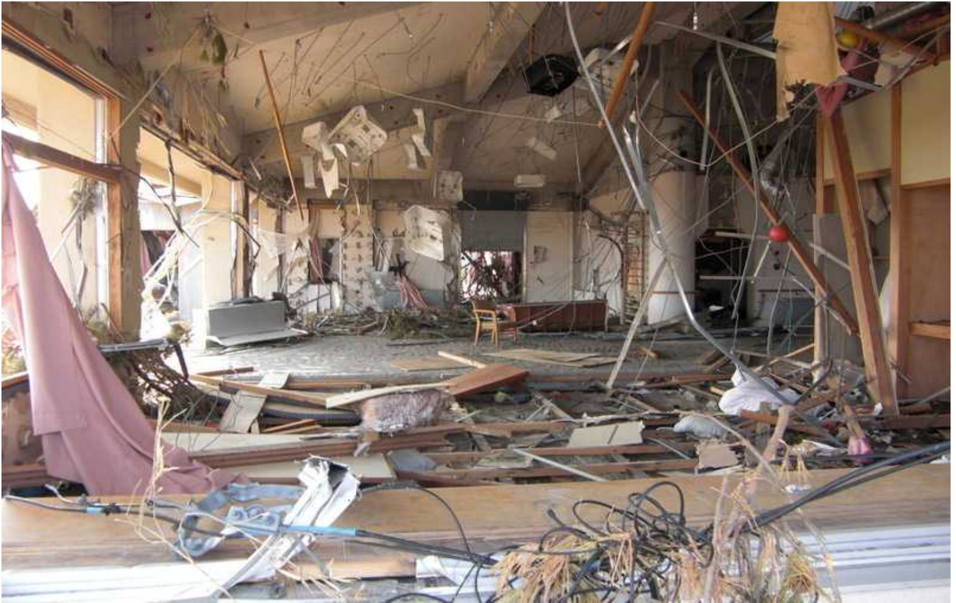
デイサービスセンターくろまつ荘の内部