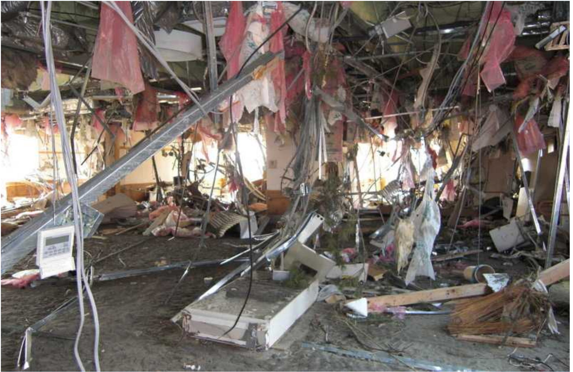
短期入所専用棟の内部