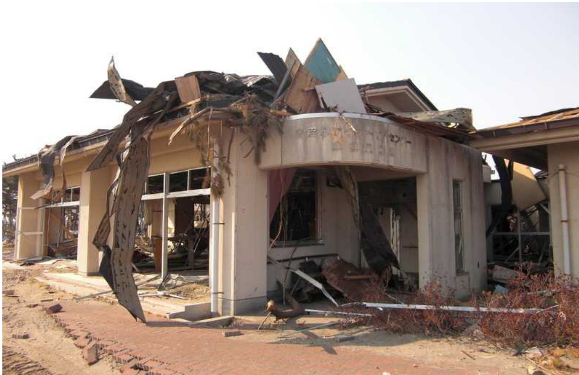
デイサービスセンターほほえみ荘の玄関前