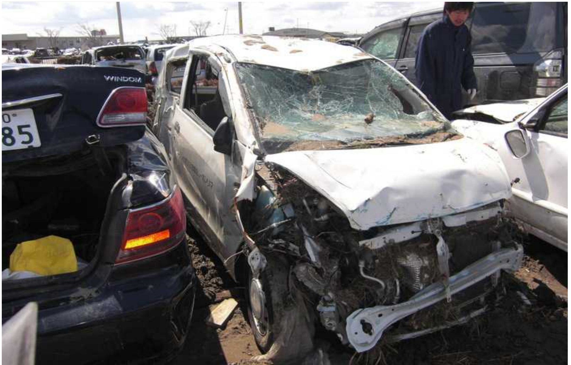
無残な姿の公用車