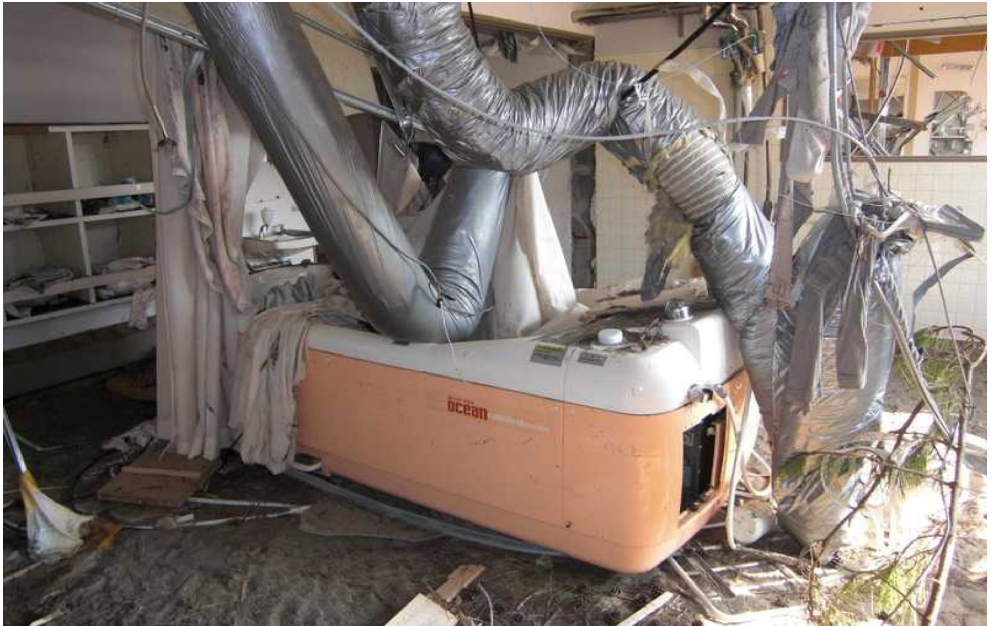
マリンホームの機械浴