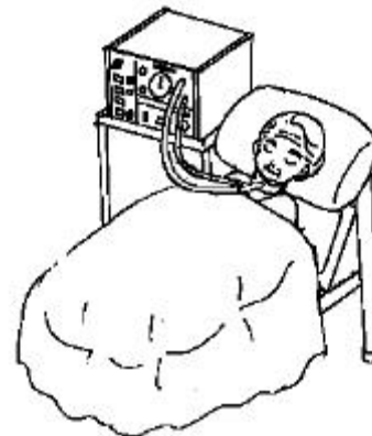
（参考2）レスピレーター（人工呼吸器）」

呼吸器疾患を背景疾患とし、間歇的酸素療法、持続的酸素療法のいずれかの酸素療法が行われているかどうかを評価する項目である。