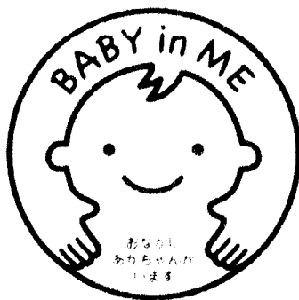
東京地下鉄株式会社 瀬沼 晃さん（東京都）の作品