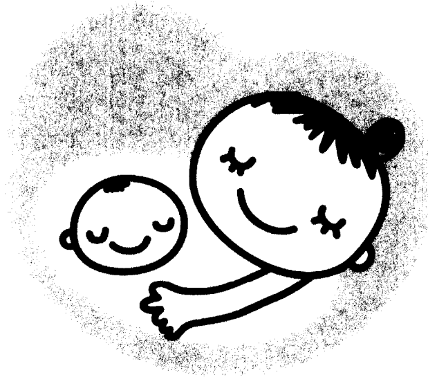
恩賜財団母子愛育会埼玉県支部（埼玉県）の作品