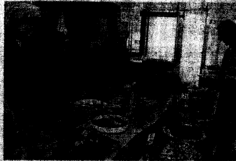
バイキングメニューが人気の山出町の里温泉