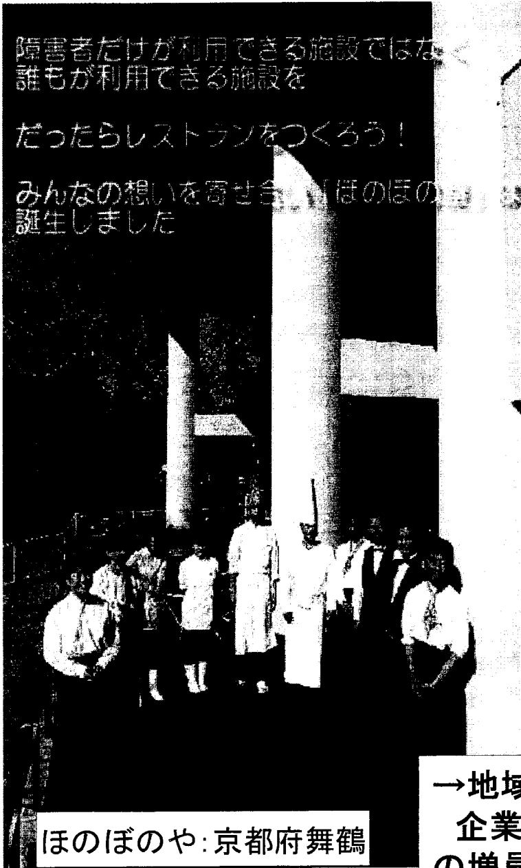
ほのぼのや:京都府舞鶴