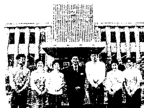
健康増進課長兼推進係のみなさん。介護保険、介護予防など連携をとる