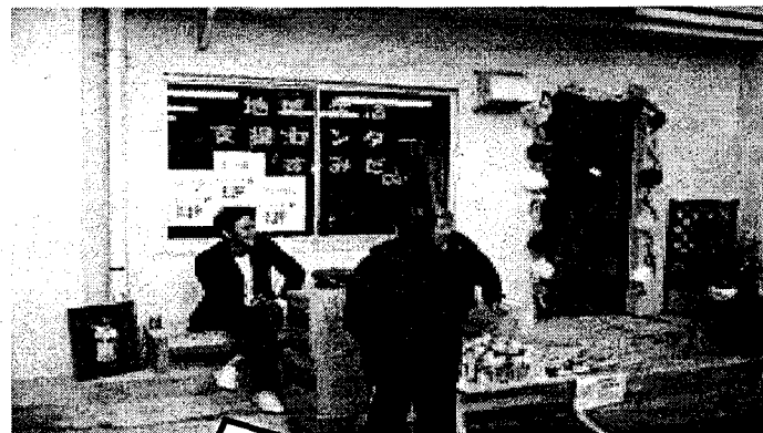
地域生活支援センター「すみだ」 (墨田区向島)