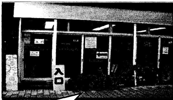
地域生活支援センター「台東」 (台東区いろは商店街)